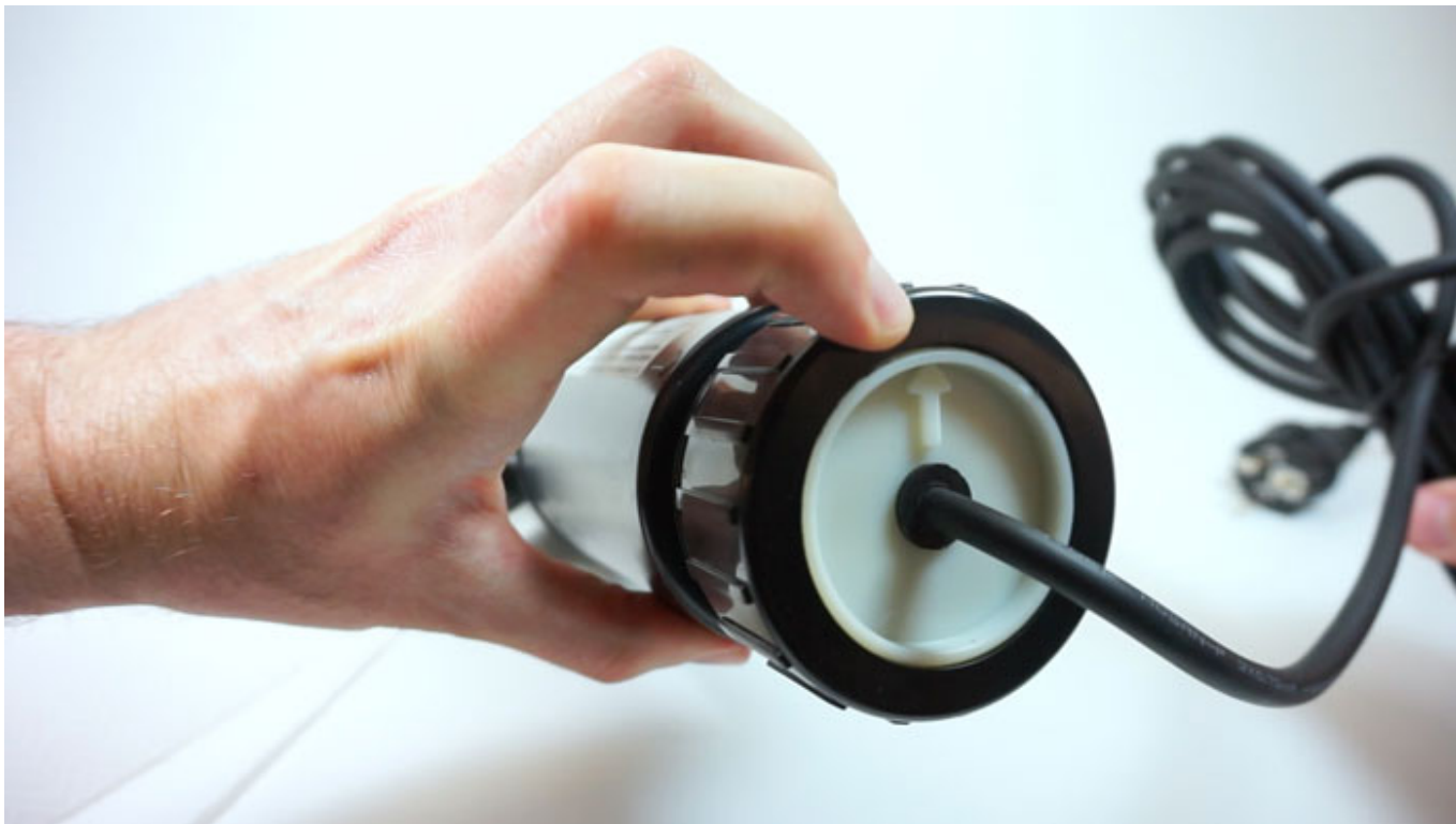
Fig. 6 e Fig. 7 - Controllare che le frecce coincidano.

7. Una volta rimontato completamente lo sterilizzatore, ma prima di rimetterlo in posizione nel laghetto, verificarne il corretto funzionamento.