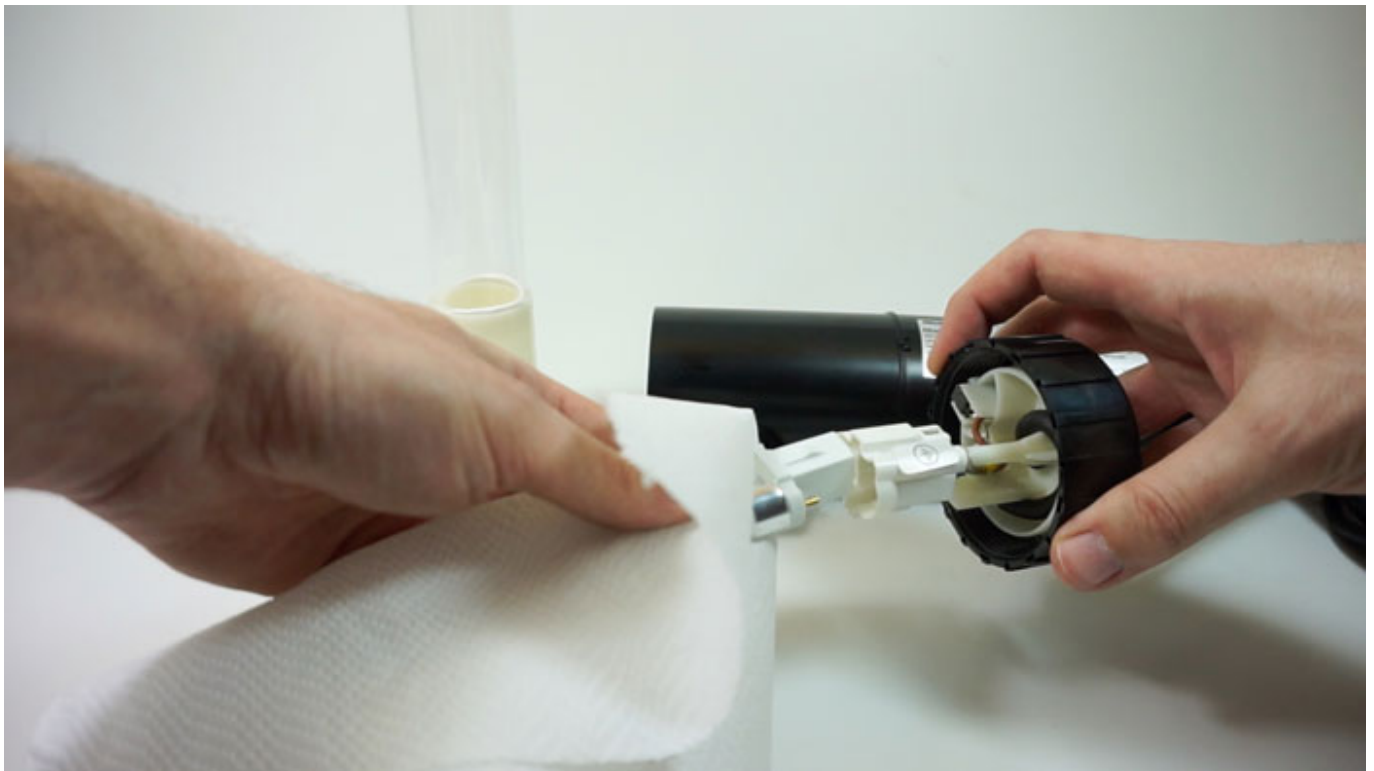
Fig. 4 - Inserire la nuova lampada UVC.

5. Nel reiserire il tubo in quarzo e controllare che le scanalature combacino.