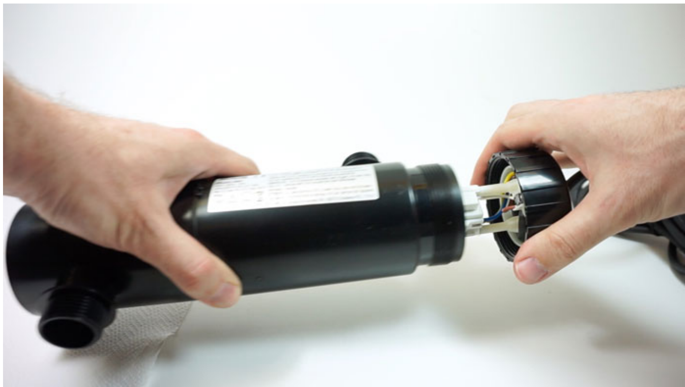
Fig. 1 - Estrarre la testa dello sterilizzatore UVC.

2. Estrarre anche il tubo in quarzo attaccato alla base bianca in plastica.