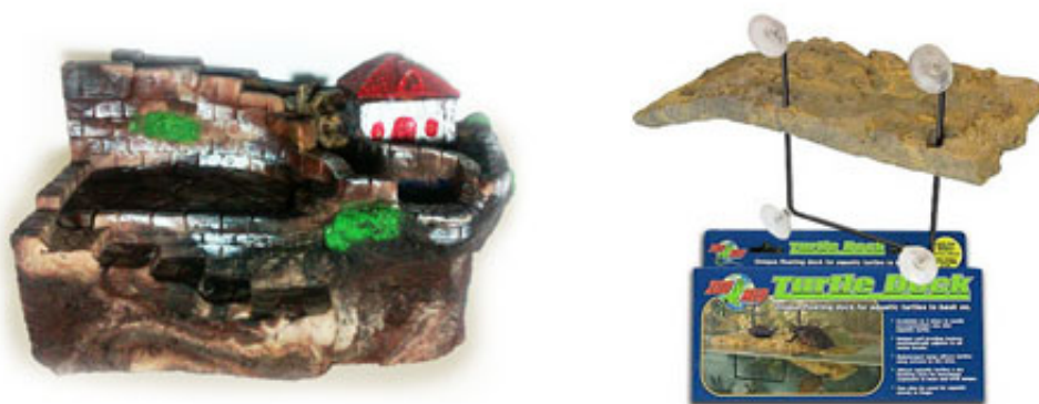
Fig. 6 - Esempio di isola filtrante e isola galleggiante.

In ogni tartarughiera non deve mai mancare un'isola, sulla quale la tua tartaruga possa uscire dall'acqua e scaldarsi alla luce. Se hai già un'isola filtrante sei a posto, altrimenti puoi aggiungere alla tartarughiera un'isola galleggiante che si adatta automaticamente al livello dell'acqua.