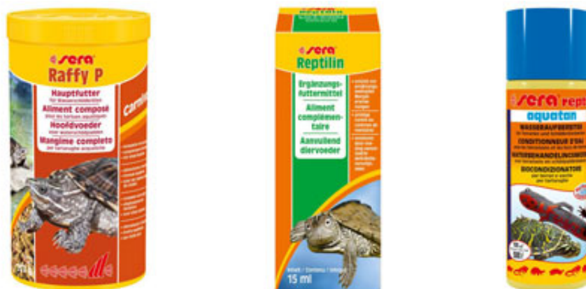
Fig. 5 - Esempi di mangime, vitamine e biocondizionatore per tartarughe.

Per quanto riguarda l'alimentazione, ti consiglio di dare alla tua tartaruga un mangime secco completo e studiato sul fabbisogno nutrizionale della sua specie, magari alternandolo con qualche mangime complementare. Inoltre le vitamine sono indispensabili come integratore alimentare; se somministrate una volta alla settimana assieme al cibo impediscono che la tua tartaruga incorra in carenze alimentari molto pericolose per la sua salute. Infine, se si utilizza acqua del rubinetto, è consigliabile aggiungere un biocondizionatore specifico che neutralizza il cloro e i metalli pesanti e rilascia acidi umici benefici per la salute della tartaruga.