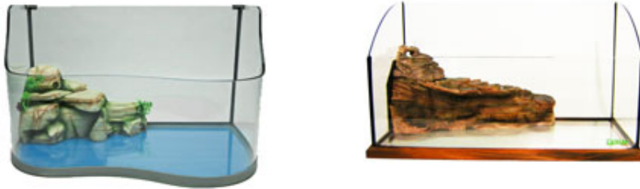
Fig. 1 - Tartarughiera con isola filtrante.