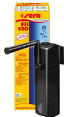
Fig. 2 - Esempi di isola filtrante, filtro esterno e filtro interno compatto.