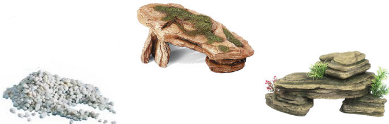
Fig. 7 - Esempi di fondo, decorazioni e isole per tartarughe.

In una tartarughiera è consigliabile mettere sul fondo un sottile strato di ghiaia grossolana che crea un ambiente più naturale e, con un semplice aspirarifiuti per acquario, non è molto difficile da pulire. Tuttavia dobbiamo fare attenzione che sia sufficientemente grossa da evitare il rischio che possa essere ingoiata dalla tartaruga (almeno 4-5mm). Per quanto riguarda il resto dell'allestimento come rocce, legni e decorazioni varie , possono essere inserite a patto che non ci sia il rischio che vengano mangiate dalle tartarughe e che non rubino troppo spazio all'interno della tartarughiera.