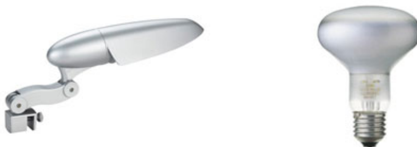
Fig. 3 - Esempi di lampade e plafoniere per tartarughiera.

lampada che emetta raggi UVB. Questo tipo di luce è indispensabile perchè le tartarughe possano produrre la vitamina D, sostanza fondamentale per evitare problemi allo scheletro e al carapace. In commercio esistono moltissime lampade di questo tipo, riscaldanti e non. Solitamente quelle che sono anche riscaldanti hanno una emissione UVB meno calibrata. Quindi l'ideale per la tua tartaruga d'acqua sarebbe avere una lampada UVB al 5% e una lampada riscaldante abbinata.