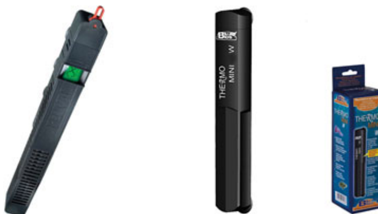
Fig. 4 - Termoriscaldatori anti urto adatti all'uso in tartarughiera.

Un altro elemento utile in una tartarughiera è il termoriscaldatore. A meno che tu non abbia la possibilità di inserirlo in una zona protetta, (es. all'interno dell'isola filtrante) è necessario che il riscaldatore sia infrangibile e possibilmente regolabile. Questo strumento, che va sempre tenuto immerso nell'acqua, serve a mantenere l'acqua stessa a una temperatura costante solitamente intorno ai 25°C e permette alle tartarughe di restare sempre attive anche durante il periodo invernale.